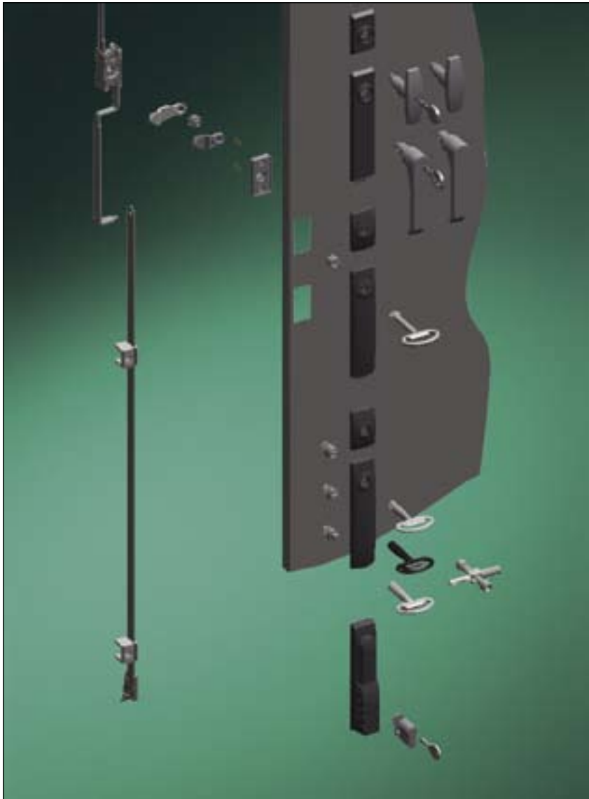
Общий вид элементов системы замков TriLine-R

Система штанг расположена с внешней стороны уплотнения. Этим обеспечивается надежность уплотнения (степень защиты). Естественно, для обеспечения соответствующих требований безопасности необходимые элементы закрытия и арматура для них входят в состав принадлежностей системы.