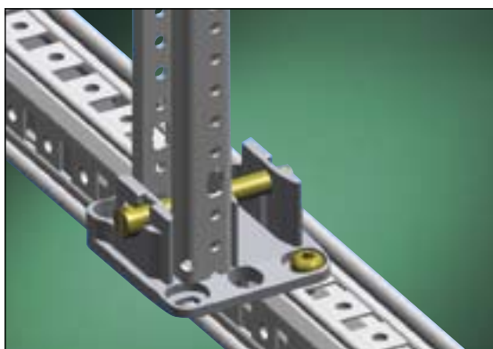
Крепление держателя рамы WR на внешнем горизонтальном профиле с помощью транспортировочного удерживающего штифта

Монтажные рамы WR, панели модульной системы TXG и монтажные платы фиксируются металлическим штифтом после осторожного нажатия. Фиксация элементов при транспортировке системы производится поворотом штифта.