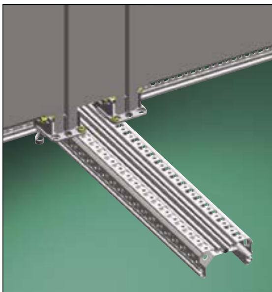
Держатель рамы WR применяется для крепления монтажных плат, монтажной рамы WR и панелей модульной системы TXG

Применяемые для различных целей совместимые части системы обеспечивают несложный монтаж и практичные решения при небольших затратах.