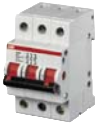
2CDC 051 002 F0004